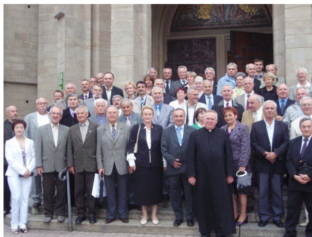
Fot. 2. Przed Kościołem Mariackim.

W przeddzień XXXV Walnego Zjazdu Delegatów SEP w Kościele Mariackim w Katowicach odbyła się msza święta w intencji elektryków.