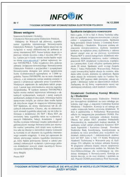
Fot. 1. Numer Infosepika – 14.12.2006 r.

Pierwszy numer Infosepika pojawił się prawie sześć lat temu w dniu 14 grudnia 2006 r. Wydawany był początkowo jako tygodnik, później przekształcił się w dziennik internetowy pojawiający się na głównej stronie internetowej SEP przez wszystkie robocze dni tygodnia, z wyjątkiem miesięcy wakacyjnych.