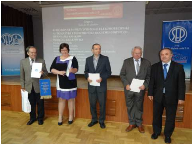
Fot.1 Laureaci konkursu w grupie kół do 30 członków na wspólnym zdjęciu z prezesem SEP

Laureatami konkursu na najaktywniejsze koło SEP za rok 2012 zostali: w grupie kół o liczebności do 30 osób – Koło SEP przy Akademii Górniczo-Hutniczej w Krakowie,