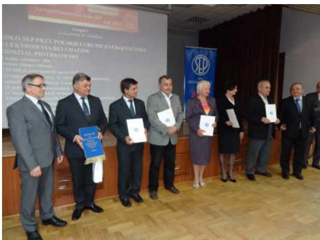
Fot. 2. Laureaci konkursu w grupie kół ponad 61 członków na wspólnym zdjęciu z prezesem SEP i prezesem Oddziału Piotrkowskiego SEP

w grupie kół o liczbie członków od 31 do 60 Koło SEP przy Politechnice Wrocławskiej, w grupie o liczbie członków powyżej 61 członków Koło SEP przy PGE GiEK S.A. Elektrownia Bełchatów,