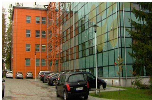
Widok Energetycznego Centrum Nauki w Kielcach