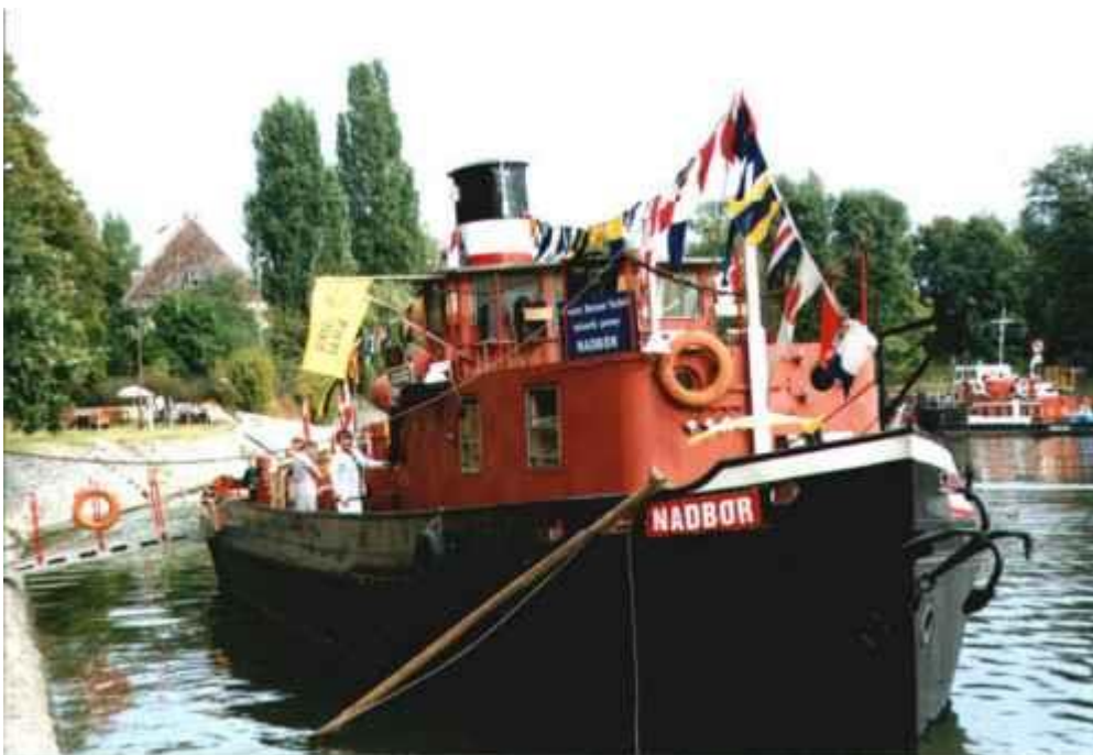
Fot. Holownik Parowy Nadbor