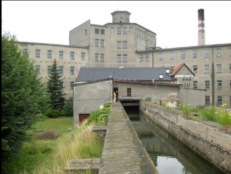
Fot. Siłownia energetyczna w Krosnowicach