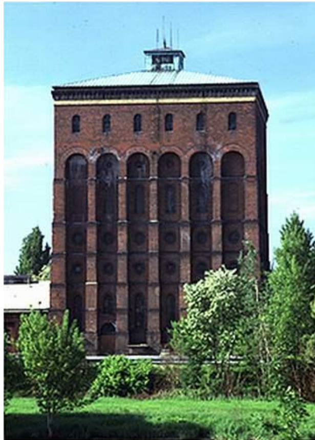
Fot. Wieża ciśnień „Na Grobli”