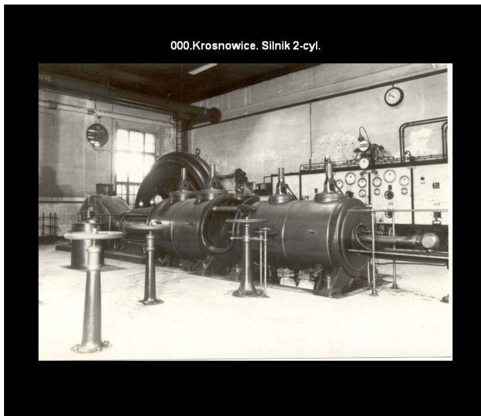
Fot. Silnik 2- cylindrowy znajdujący się w Siłowni energetycznej w Krosnowicach