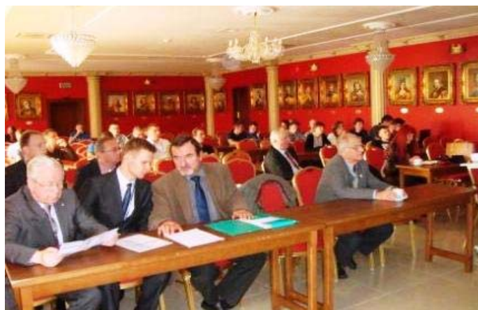
Fot. 7 - sala obrad