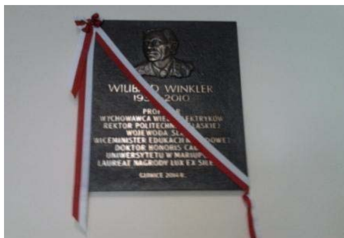
Fot. 5 - tablica pamiątkowa prof. W. Winklera

Andrzej S. Grabowski, Oddział Gliwicki SEP