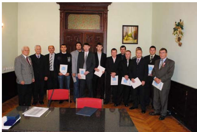
Fot. 3. Nagrodzeni absolwenci Politechniki Koszalińskiej – laureaci Konkursu na najlepszą pracę dyplomową z dyplomami z rękach.