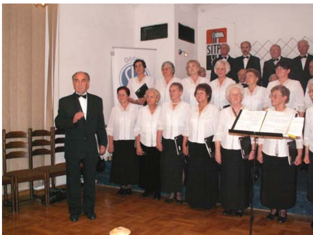
Fot. 8. Występ chóru Albertinum.

Życzenia Oddziałowi-Jubilatowi złożyli przedstawiciele Oddziałów Krakowskiego, Tarnowskiego, Tarnobrzeskiego oraz zaproszeni gości. Wieczór uświetnił występ chóru Albertinum, który po części oficjalnej włączył się do wspólnego śpiewania "biesiadnego" przez wszystkich uczestników.